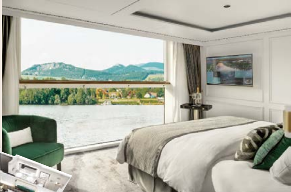
雙人豪華房 23.5m 2