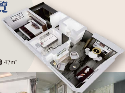
樓上雙人套房 47m 2