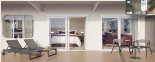
尊貴套房 72+13m 2