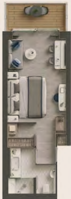
陽台套房 Veranda Suite 33m 2