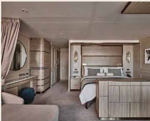
銀海套房 Silver Suite 50m 2