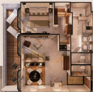
小型閣樓套房 43m 2 +15m 2