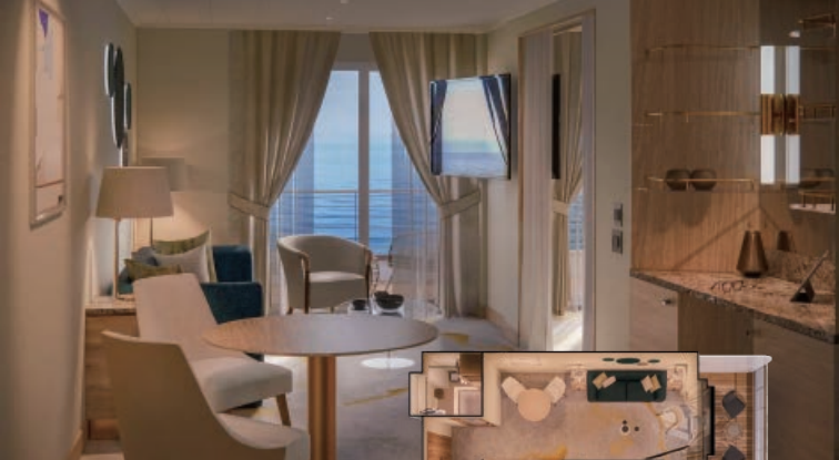
藍寶石陽台套房 40m 2 +10m 2